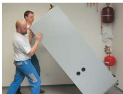
Die Wärmezentrale ankippen und richtig platzieren.