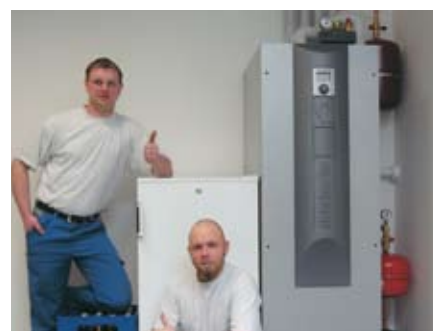
Fertig! So einfach kann's gehen.