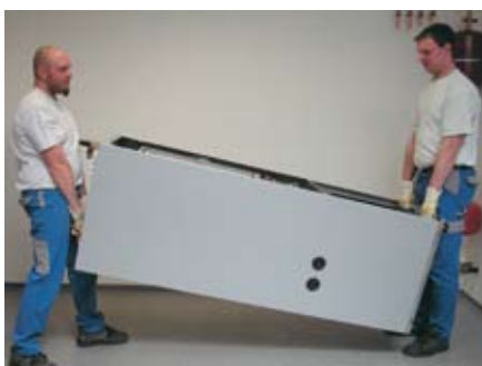
Einfacher Transport durch herausnehmbare Kältebox.