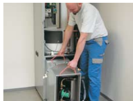
Kältebox in das Gerät schieben.